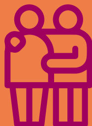
Zorg voor elkaar