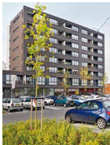
Houtweg 301-339 en 106-144, Emmen