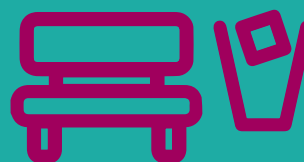
Veilig & fijn wonen