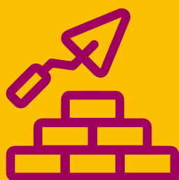
Straten & stenen

In het voorjaar van 2022 wordt er weer een Burgerbegroting in Emmerhout georganiseerd. Wijkbewoners worden uitgedaagd met plannen voor de wijk te komen. Vanuit de Burgerbegroting is er geld beschikbaar om deze plannen uit te voeren. De opzet van deze burgerbegroting is iets anders dan in voorgaande jaren. In deze Wijkberichten wordt dat toegelicht.