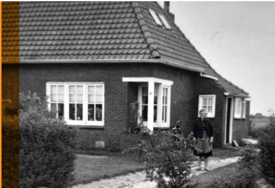
Foto: moeder voor de woning aan de Randweg 31